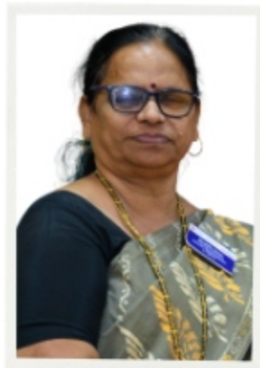
PP Shraddha Soman Avenue Co-chair Zone IV Membership Retention